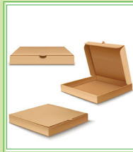
Cajas de pizza relativamente limpias