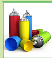
Latas vacías de Aerosol