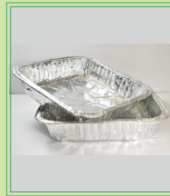
Contenedores y papel de aluminio limpio