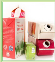
Cartones de bebidas

Si no tiene un contenedor de reciclaje, puede poner los artículos para el reciclaje en una caja de cartón, un contenedor de su preferencia marcado, o una bolsa de papel.