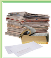
Sobres, periódicos, y papel