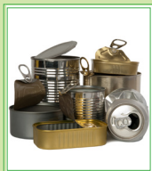
Contenedores de metal para comida y bebidas