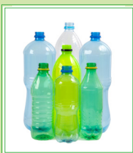
Botellas vacías de agua, refresco, o jugo