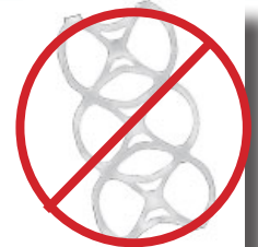
Anillos de plástico