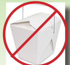
Contenedores de comida para llevar