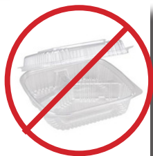
Contenedores de delicatessen y escalades