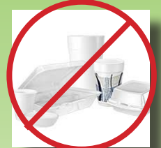
Vasos de poliestireno y platos de papel