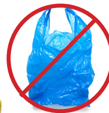
Bolsas de plástico