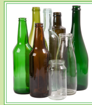
Botellas y tarros vacías de vidrio